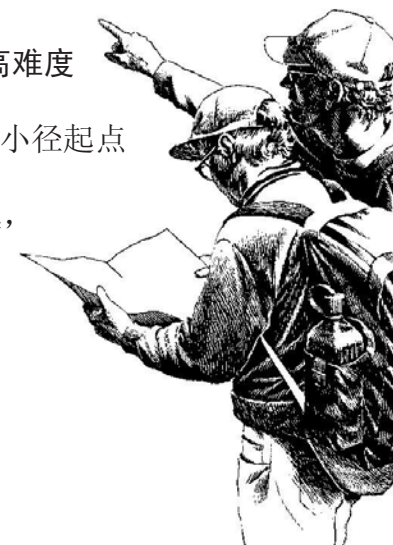
绘图：Lawrence W. Duke

全程15.5公里；975米，6至8小时 起点一：南侧路(Southside Drive)的四英里小径起点 起点二：穿梭巴士7号站(全程多800米) 这条小径是从哨兵岩(Sentinel Rock)下方起，蜿蜒而上至约塞米蒂山谷上的冰川顶(Glacier Point)。行走这条小径可以欣赏到约塞米蒂瀑布、酋长岩(El Capitan)和半屏丘(Half Dome)的美丽风光。夏季时可以搭乘穿梭巴士到冰川顶，再走这条小径下山。 (穿梭巴士详情请参阅全景小径说明。) 冬季这条小径因冰雪覆盖而封闭。